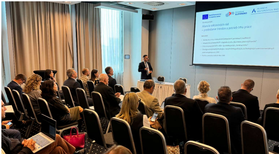
Konferencia: „Inštitucionalizácia aktivít Aliancie sektorových rád“