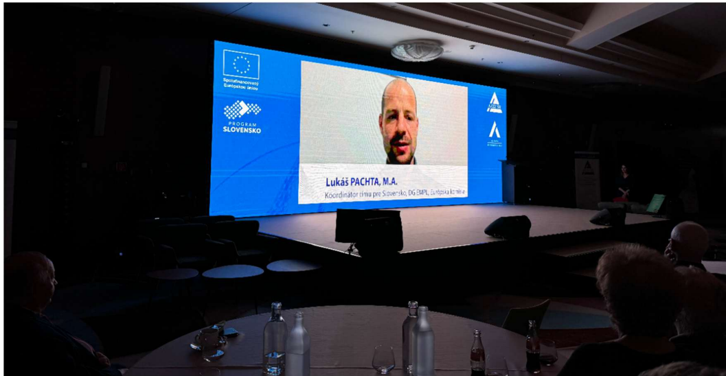
Príhovor zástupcu Európskej komisie, pána Lukáša Pachtu.