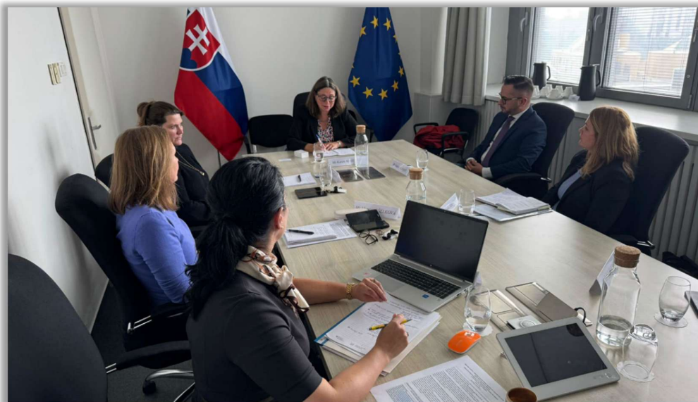
Stretnutie ASR a OECD.